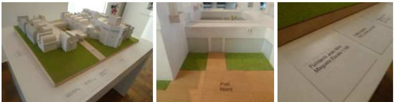
1, 2 y 3. Maqueta del edificio de la fundacion Miró, con informacion en relieve y textos en Braille