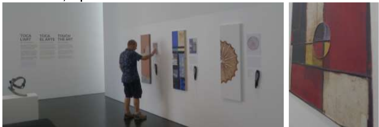
4. Sectores de obras de arte ampliadas, con relieve e infomación auditiva