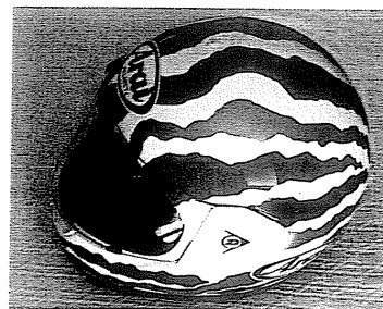
El casco salva muchas vidas

El airbag es un dispositivo de seguridad «activo», pues sólo funciona cuando hace falta. Cuando se produce un golpe potencialmente peligroso, se activa el mecanismo que abre una cápsula de aire comprimido o que provoca una reacción química en la que se libera gran cantidad de gas en muy poco tiempo. Ese aire o esos gases inflan rápidamente una bolsa contra la que chocan los viajeros, pero se trata ya de una superficie mayor y poco rígida que además, al ser deformable, consigue aumentar el tiempo de frenado, con lo que se evitan muchas de las lesiones que podrían producirse.