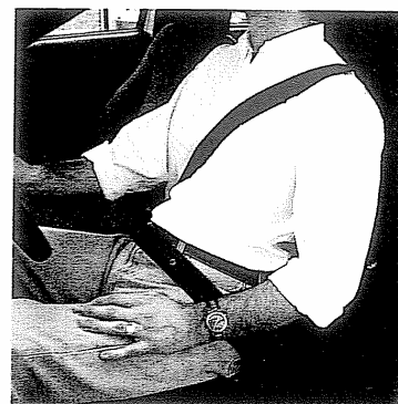
Muchos de los muertos en accidentes de tráfico no llevaban el cinturón de seguridad.